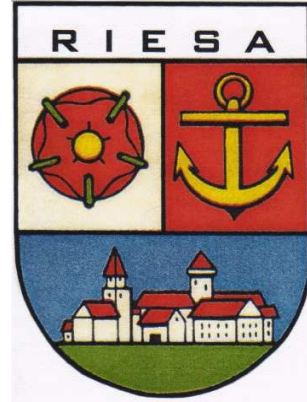
(2) Das Wappenschild