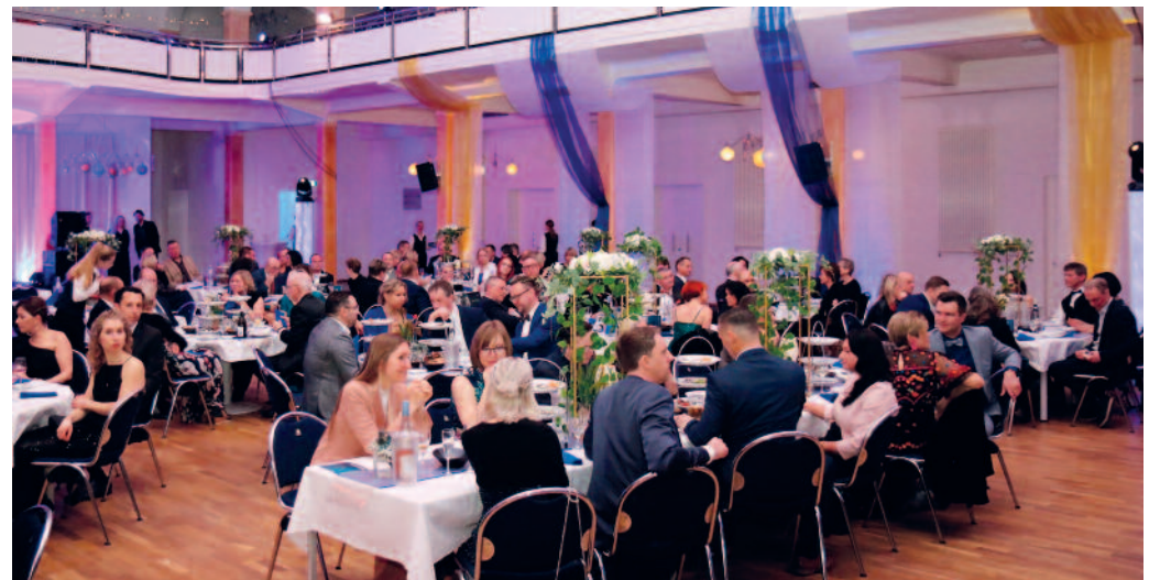
Im sehr geschmackvoll dekorierten Saal genossen die Gäste die Ball-Atmosphäre.