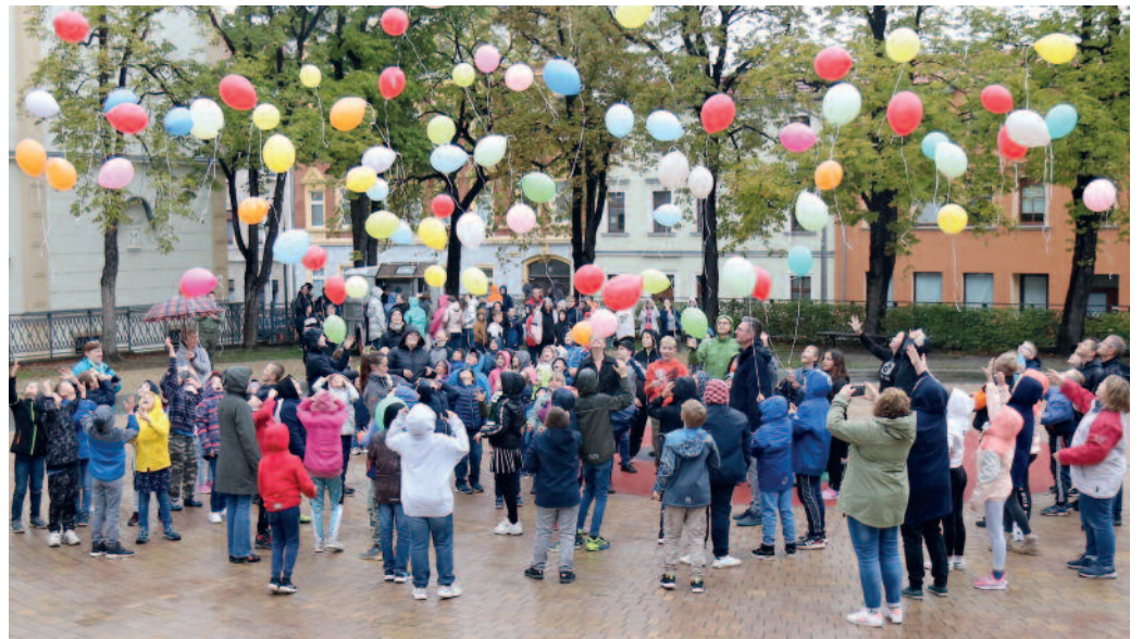
Als Signal für alle Kinder unserer Welt ließen die Schüler Luftballons aufsteigen.