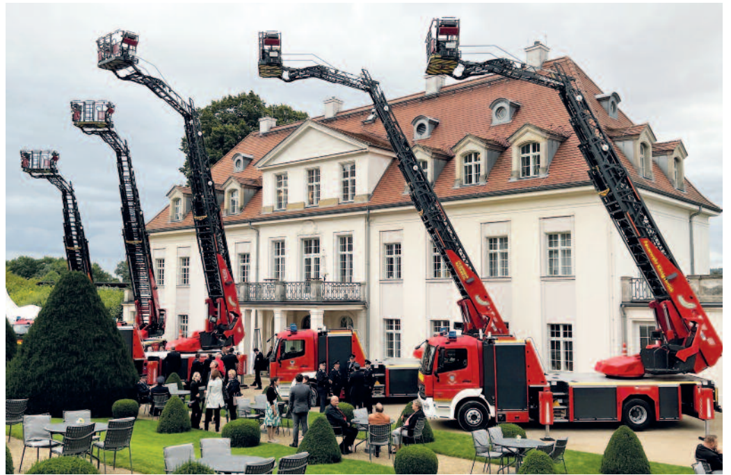
Große Drehleiterparade im historischen Ambiente: Auf Schloss Wackerbarth wurden die gemeinsam angeschafften Fahrzeuge aus fünf Städten offiziell übergeben, in der Mitte das Auto aus Riesa.