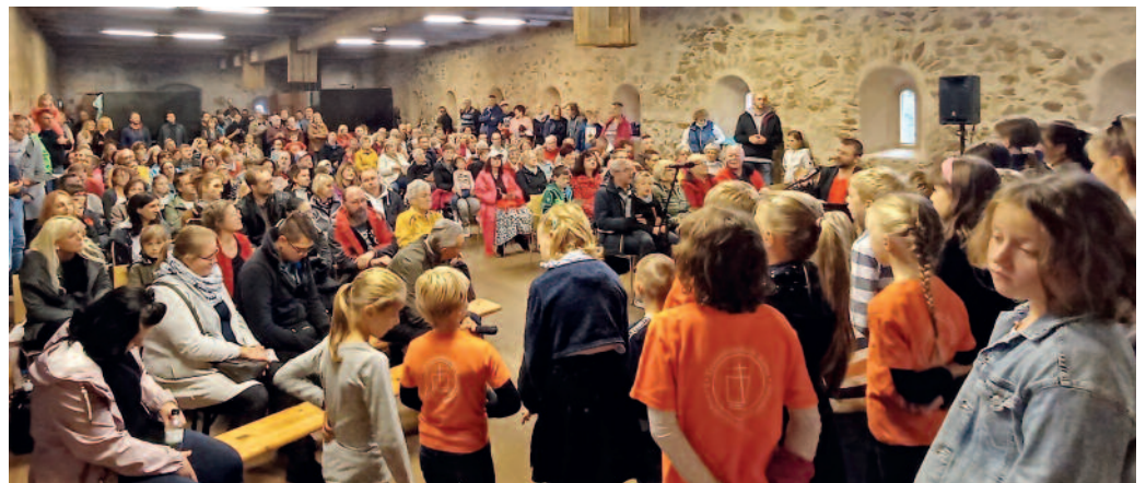
Riesa wie es singt und klingt: Die vielen Stimmen von Jung und Alt ergaben einen ganz eigenen Chor.