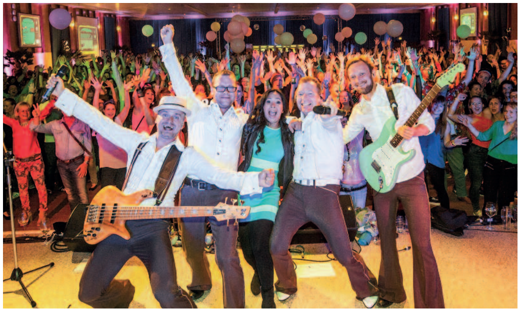
Nightfever sorgen am Sonnabend auf dem Rathausplatz für Stimmung.

spielsweise das Festgebiet. Es umfasst den Rathausplatz und die Hauptstraße bis zur Niederlagstraße, dann auch die Niederlagstraße selbst, die Elbstraße und den Elbeparkplatz. „Diese Änderung rührt aus den Erfahrungen zum Tag der Sachsen“, so FVG-Veranstaltungsleiter Dirk Mühlstädt. Die Wiese unterhalb der Sparkasse wird zum „Hüpfburgland“, der Rummel auf dem Parkplatz aufgebaut. Daneben ist auch noch Platz für ein Partyareal. Vervollständigt wird das Festgelände durch die große Wiese im Stadtpark. Hier rufen die Stadtwerke Riesa zur beliebten und zudem lehrreichen VOLLTREFFER-Erlebniswelt.