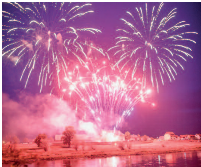
Wie beim Tag der Sachsen soll das Feuerwerk erneut auf dem anderen Elbufer vor Schloss Promnitz gezündet werden.

Nicht zuletzt ermöglicht die Einbeziehung der Elbwiesen einen entspannteren Umgang mit dem spätabendlichen Feuerwerk: Es wird erneut vor Schloss Promnitz inszeniert, die Zuschauer haben auf der Riesaer Elbseite deutlich mehr Platz als früher vor dem Rathaus. Aufgrund der langen Helligkeit Anfang Juli verzichtet man auf ein extra Kinderfeuerwerk, was kaum zu sehen wäre. Den Lampionumzug und eine Feuershow werden aber nach wie vor stattfinden. Das Bühnenprogramm verspricht den bewährten Mix aus Auftritten einheimischer Künstler und Vereine, Kinderanimation und fröhlicher Party-