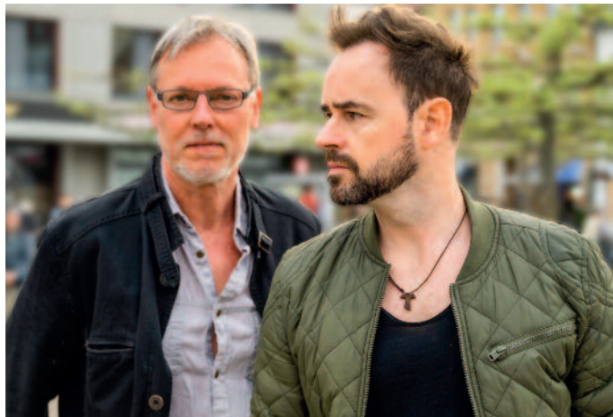
Murphy's Law spielen bei „Live im Tierpark“.

Im Tierpark Riesa wird es musikalisch: Die langjährige Veranstaltungsreihe „Live vom Balkon“ aus der SACHSEN-arena kommt erstmals für drei Termine in den Tierpark Riesa. Passend zur anstehenden Open-Air-Saison präsentiert die FVG Riesa das neue Veranstaltungsformat „Live aus dem Tierpark“. Den Besuchern wird auf der Terrasse am Schwanensee nicht nur handgemachte Livemusik geboten, sondern auch eine besonders gemütliche Atmosphäre. Das Auftaktkonzert bestreitet am Sonntag, dem 26. Juni, das Künstler-Duo „Murphy's Law“. Ein weiteres musikalisches Duo folgt mit „Edgar & Marie“ am Sonntag, dem 10. Juli. Das Abschlusskonzert wird von „Lea Wilhelm & Band“ am Sonntag, 7. August, gespielt. Alle Konzerte beginnen 19.15 Uhr. Einlass ist eine Stunde vorher, dann haben die Gäste die Möglichkeit, in der Zeit bis zum Veranstaltungsbeginn den Riesaer Tierpark näher kennenzulernen. Der Eintritt ist bereits im Konzertticket inbegriffen.