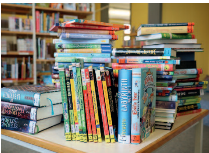
Reichlich Lesestoff für den Sommer: Jetzt schon können sich große und kleine Lesehungrige für die Ferienaktionen anmelden.