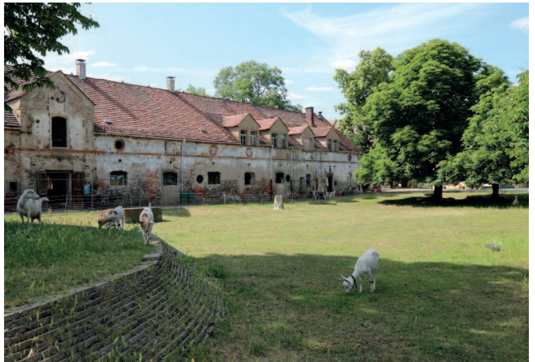
Eine schöne Idylle ist nicht alles: Auf Gut Göhlis herrscht auch „Investitionsstau“.

Alle im Gutsgelände ansässigen Akteure stellen nun ein gemeinsames Hoffest auf die Beine, um die Anlage bei den Riesaern wieder „in Erinnerung“ zu bringen und denjenigen zu präsentieren, die sie noch gar nicht kennen. Alle Neugierigen sind dazu am Sonnabend, 25. Juni, ab 14 Uhr auf das Gut Göhlis eingeladen. Zum Programm gehören ein