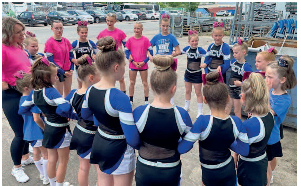
Das gemeinsame Einschwören hat geholfen: Der RCV holte zwei Meisterschaftsmedaillen.

Respekt für großen Ehrgeiz und Fleiß in der Vorbereitung sowie die Nervenstärke im entscheidenden Moment. Den Trainerinnen und Trainern ein riesiges Dankeschön für ihr Engagement, das Erarbeiten der Routine, das konsequente und zielgerichtete Einstudieren der Elemente und des Wettkampfprogramms, das Motivieren der Teams in schwierigen Momenten, das Formen von Einzelsportlern zu einem Team und und und... Allen Eltern wiederum gilt ebenfalls ein großer Dank für das Einschränken von Familienaktivitäten, um das regelmäßige und zusätzliche Training zu ermöglichen, das mentale Wiederaufbauen nach einem schlechten Trainingstag, das Unterstützen der Trainer, das „Catering“ am Wettkampftag und vieles mehr. Allen Fans