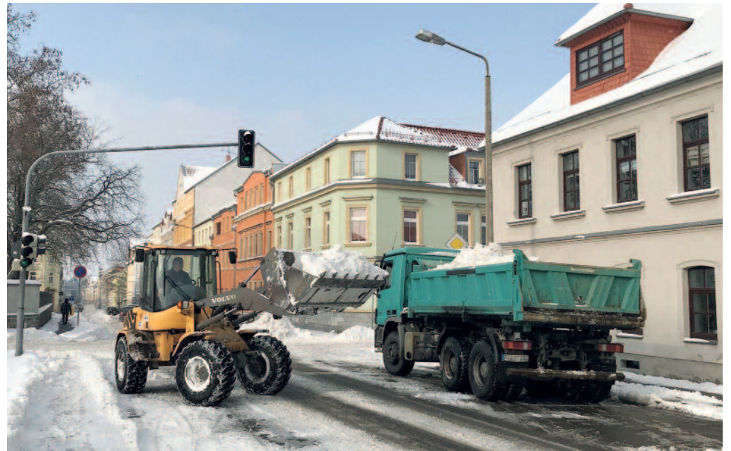
Per Radlader und Lkw wird seit Dienstag ein Teil des Schnees von den Straßen (hier auf der Goethestraße) abtransportiert. Er wird auf dem Parkplatz vor der SACHSENarena abgekippt.