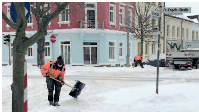
Die Handstreckkräfte haben einen schweren Job und schaffen für die Fußgänger Durchlässe durch die hohen Schneehaufen.

den Fahrzeugen waren zahlreiche Handstreckkräfte im Einsatz, um vor allem die Straßenquerungen freizubekommen. Natürlich war es bei der schie-