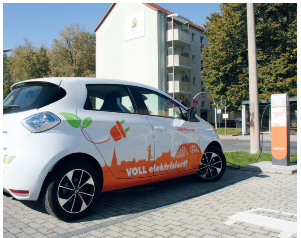
Mit der E-Tankstelle an der Alleestraße sind zwei der ersten neuen Ladepunkte in Riesa entstanden.

16 der öffentlichen Ladepunkte wurden und werden bis Ende des Jahres errichtet und in Betrieb genommen, 2 im Jahr 2020 nach Abschluss der Sanierung der Oberschule Merzdorfer Park. Wir stellen Ihnen die Standorte im Rahmen einer kleinen „Bildserie“ in unseren nächsten Ausgaben vor.