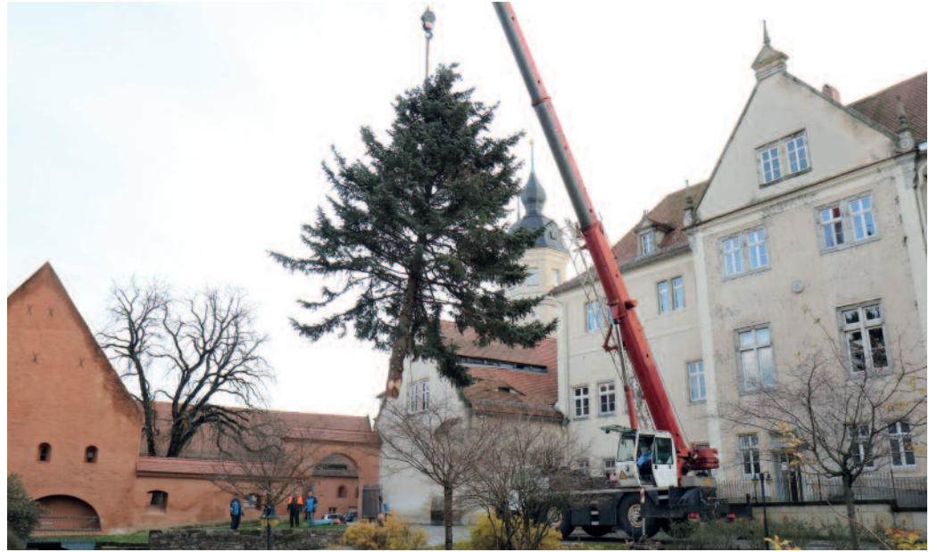
Einflug des Weihnachtsbaumes. Die Blaufichte kam diesmal „überelbsch“ von einem Merschwitzer Spender.