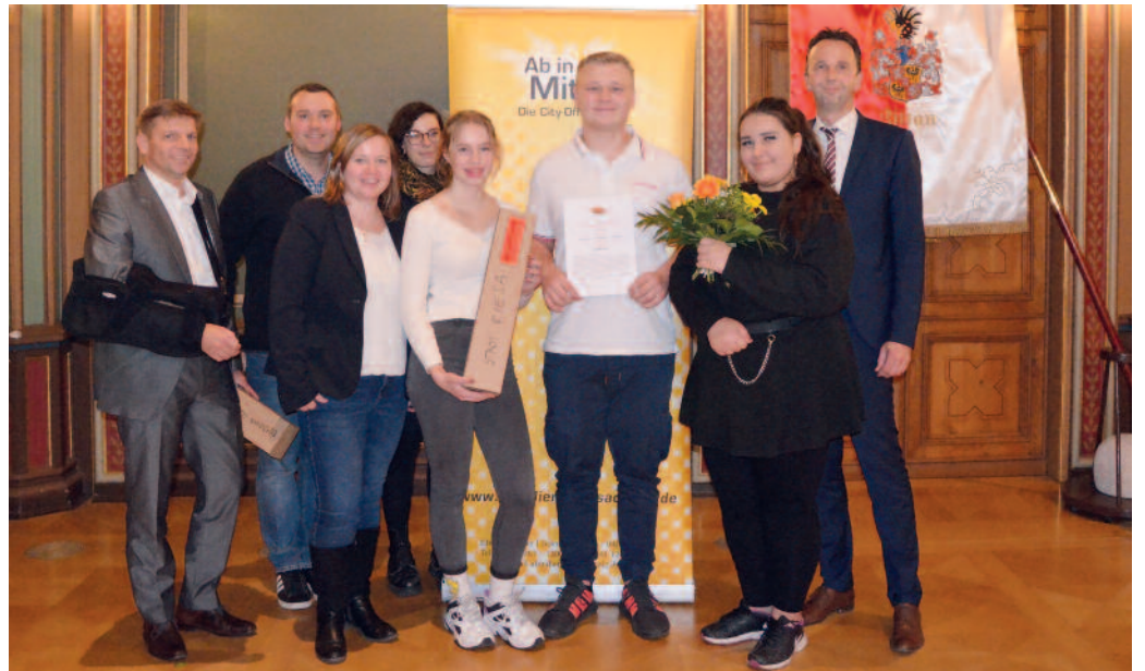
Fröhliche Mienen bei der Riesaer Delegation nach der Preisverleihung im Zittauer Rathaus.