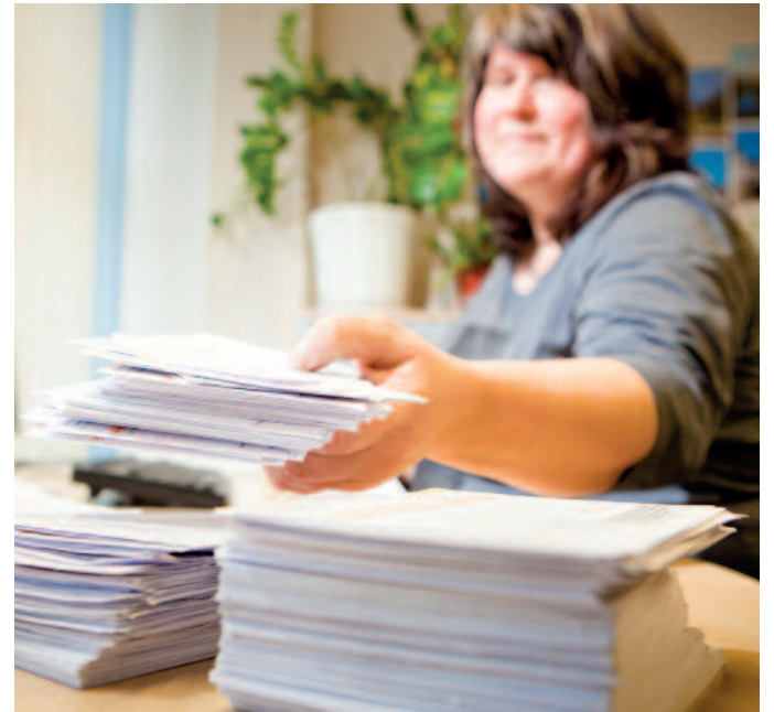
Der Bereich Energieabrechnung der Stadtwerke Riesa versendet ab Montag, dem 9. Dezember ungefähr 23.000 Ablesekarten.

Die SWR empfehlen grundsätzlich, den Zählerstand termingerecht mitzuteilen bzw. die Ablesung den Mitarbeitern der SWR oder deren Beauftragten zu ermöglichen. Denn liegt den SWR kein Zählerstand vor, kann das