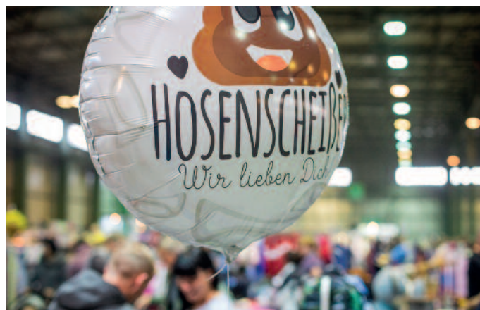
Schnäppchen gibt es beim Hosenscheißermarkt in der Arena.

Die PIESAcker verwirren mit dem Namen ihres neuen Programms „Blick nach oben! Es geht bergab!“ wieder mit voller Absicht. Das Riesaer Kabarett ist in der Gaststätte „Zum Bürgergarten“ zu erleben. Termine sind Freitag, 6. Dezember,