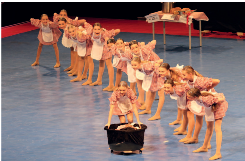
Das Handwerk, hier viele tanzende Bäckerinnen, prägt Riesa seit Jahrhunderten.