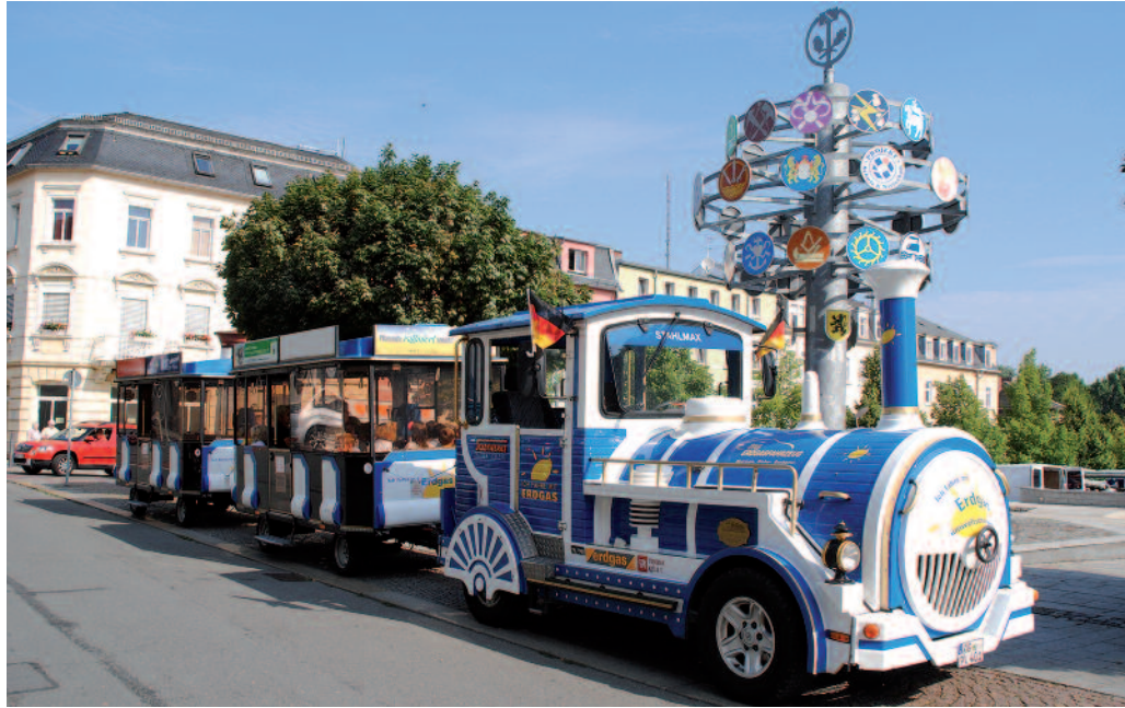
Die beliebte Bahn Stahl-Max hat einen Motorschaden und benötigt dringend die Hilfe der Riesaer.

Jetzt benötigt die Stadtbahn die Hilfe aller Riesaer. Für den Stadtbahnverein ist der Ernstfall eingetreten: Ein Motorschaden verhindert im Moment den Einsatz der beliebten Bahn. Der Gesamtschaden beträgt ungefähr 12.000 Euro, eine Summe,