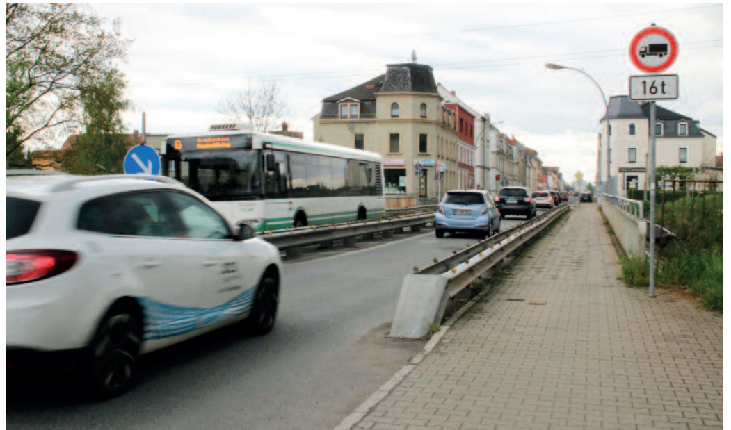
Ab Montag, 15. Mai, ist die Brücke Lange Straße für den Autoverkehr gesperrt.