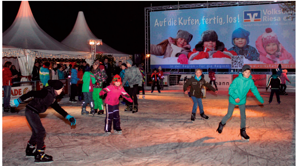
Die Volksbank-Eisbahn ist an allen Tagen stärkster Publikumsmagnet der Klosterweihnacht.

in der dritten Auflage den Geschmack vieler Riesaer endgültig getroffen zu haben. An allen Tagen strömten die Menschen in Scharen in den Klosterinnenhof und genossen die heimelige Atmosphäre zwi-