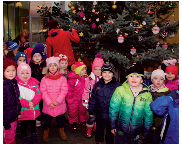
Mit viel Liebe bastelten die Kinder aus der DRK-Kita am Technikum schönen Schmuck für den Weihnachtsbaum in der Volksbank.

Mit selbstgebasteltem Weihnachtsschmuck haben die Kinder der DRK-Kindertagesstätte am Technikum den Tannenbaum in der Schalterhalle der Volksbank Riesa in einen wunderschön geschmückten Weihnachtsbaum verwandelt. „Wir freuen