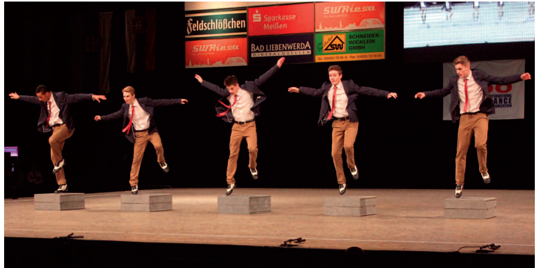
Da staunt sicher sogar die Queen: Englands Tänzer von „Tap Attack“ verteidigten ihre WM-Titel in der kleinen Gruppe (Foto) und bei den Formationen mit fulminanten Shows.