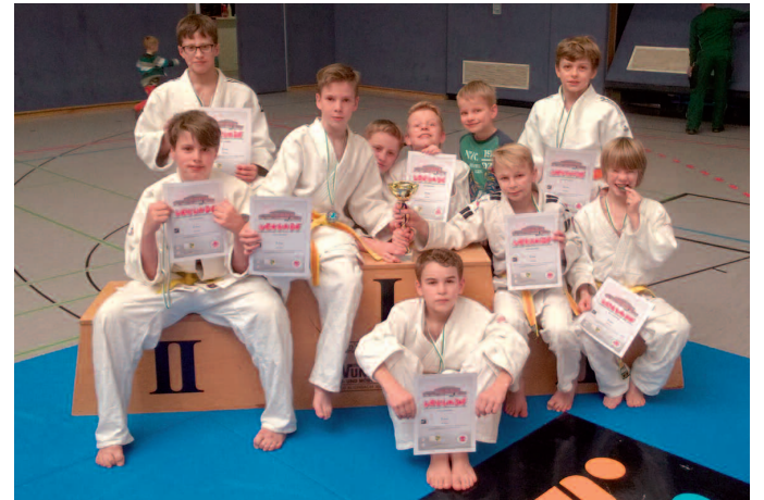
Stolz präsentiert das Jungsteam des VfL Riesa den silbernen Pokal.