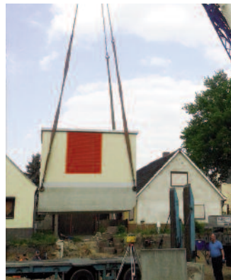
Anlieferung der Trafostation im Kreuzungsbereich Strehlaer Straße und Oststraße

Gasversorgung erneuert. Umgesetzt wird dies durch die EGR Energiegesellschaft Riesa, einem Tochterunternehmen der SWR. Dabei handelt es sich um eine gemeinsame Maßnahme mit der Wasserversorgung Riesa-Großen-