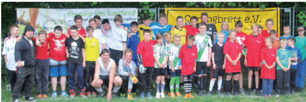
Einen schönen und vor allem fairen Fußball-Nachmittag erlebten diese sechs Teams.

Das Ergebnis: 1. Mehltheuer, 2. Die FlugBummis, 3. Arnold Strehla, 4. Die Bayern-Sack-Ratten, 5. Weida STARS, 6. Die BayernKidS.