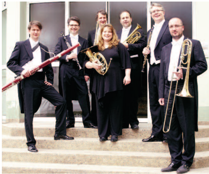
Die Bläsersolisten der Elbland Philharmonie Sachsen.