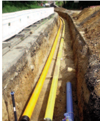
Verlegung der Nieder- und Hochdruckgasleitungen Ros-tocker Straße

Auf der Paul-Greifzu-Straße wurden bereits die ersten Teilstücke der Gasleitungen verlegt und eine neue Trafostation gesetzt. Die Realisierung der Strom- und Gasstrassen müssen auch hier mit allen anderen Ver- und Ent-