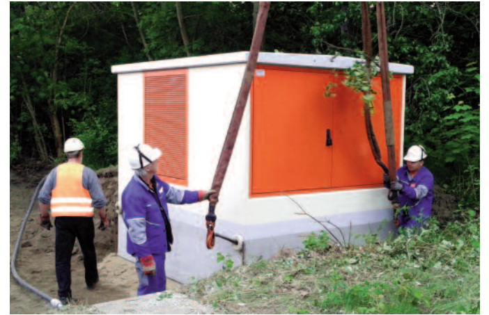
Setzen der Trafostation Paul-Greifzu-Straße

Derzeit werden auf der Felgenhauer Straße Hausanschlüsse für die Strom- und