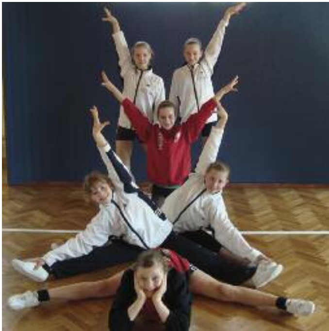
Auch im Sachsen-Team sind zwei Riesaerinnen (in Rot) vertreten.

Tickets für die Meisterschaften gibt es an der Erdgasarena sowie an allen bekannten Vorverkaufsstellen und im Internet. Es werden sowohl Tagestickets für 13 Euro angeboten als auch ein vergünstigtes Wochenendticket für 20 Euro. Inhaber einer Gymcard erhalten weitere Rabattierungen. Weitere Informationen unter: Tickethotline: 03525-601160, www.erdgasarena.de , www.facebook.com/erdgasarena