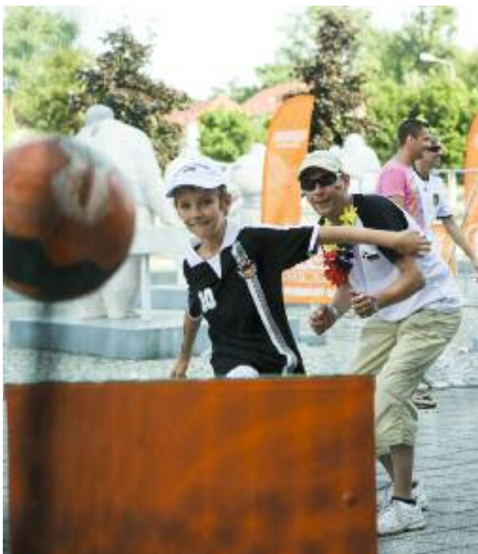
Vor der Arena gestalten die SWR wieder ein energiegeladenes Rahmenprogramm. Vereine, die bei der Projektförderung dabei sind, können hierbei Stimmcodes für ihr eingereichtes Projekt sammeln.

*Ausgenommen sind Tore im Elfmeterschießen.