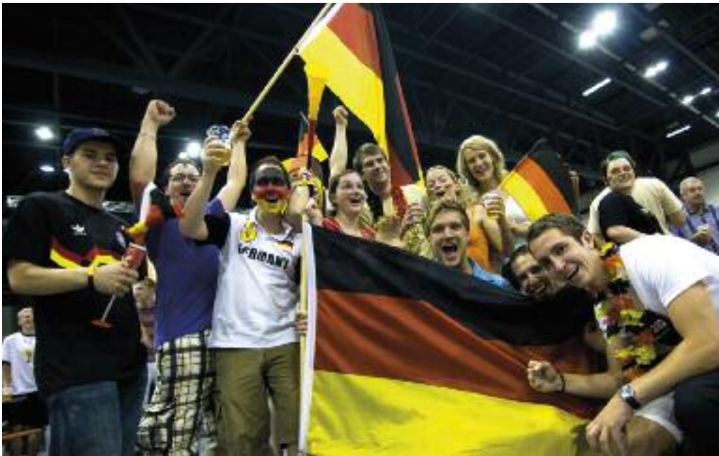
Wie zur WM 2010 erwarten die Arena und die SWR in Spitzenspielen weit über 1.000 Fans.

Das Warten aller Fußballfans hat ein Ende: Zur Fußball-Europameisterschaft veranstalten die FVG Riesa mbH und die Stadtwerke Riesa in der Erdgas Arena erneut gemeinsam die „VOLLTREFFER! Fanfete“. Übertragen werden alle Deutschland-