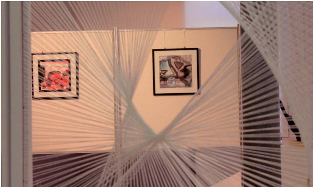
Fadengrafik, Malerei und Specksteinskulpturen prägen die Ausstellung im Stadtmuseum.