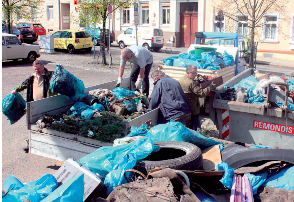
Mitarbeiter des Rathauses und vom Sprungbrett e.V. laden den Unrat in die Container.

Die Palette dessen, was die ordnungsliebenden Riesaer aus Büschen und Gräben fischten, reicht vom simplen Papier über Verpackungen al-