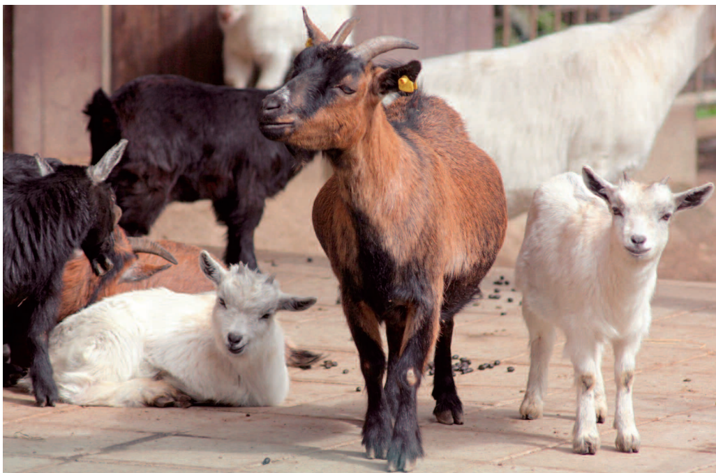
Hallo, wir sind die Neuen! Nicht nur bei den Ziegen ist Nachwuchs angekommen.

nern des Tierparks zu schauen. Im Frühling haben mehrere Tierkinder das Licht der Welt erblickt. Das kleine Mufflon klettert an der Seite seiner Eltern schon mutig die Felsen auf und ab. Richtig wuselig geht es im Streichelgehege bei den Ziegen zu. Die schwarzen und weißen Gesellen, bei denen die kleinen Hörnchen noch wachsen, sind unheimlich neugierig und fast immer in Bewegung. „Zwei Babys stehen noch aus, vielleicht sind sie Ostern schon da“, freut sich Tierparkleiter