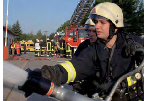
Die Kameraden der Freiwilligen Feuerwehr haben bei der Großübung einen guten Job gemacht.