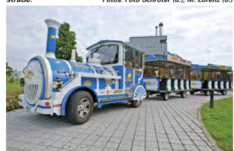
Mit einer Vereinsmitgliedschaft für nur drei Euro im Monat kann jeder den Verein unterstützen - egal ob Privatperson oder Großunternehmen. Eine andere Möglichkeit bieten die symbolischen Stadtbahnkarten im Wert von 10, 25 und 100 Euro.