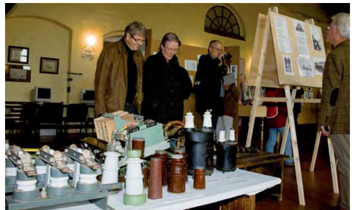
Die Ausstellung über die 100jährige Geschichte des E-

Werkes in der Lichtstraße in Oschatz ist wochentags von 10 bis 20 Uhr mit Führungen jeweils um 10, 13 und 17 Uhr zu sehen. Die letzte Möglichkeit einen Teil der Ausstellung zu besichtigen, gibt es am 24.10. zum