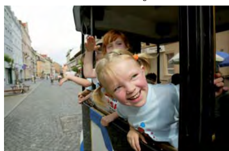
30 Fahrgäste haben Platz. Aber nicht nur im Linienbetrieb. Mit weit über 1.000 Sonderfahrten sorgte „Stahlmax“ schon bei vielen Anlässen für den besonderen Akzent - ob als „Hochzeitskutsche“ oder Erdgas-Arena-Shuttle.