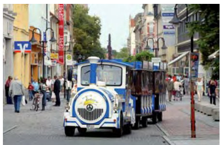
Die Strecke mit insgesamt 16 Haltestellen führt über rund zweieinhalb Kilometer zwischen Rathaus und Riesenhügel. Damit spult „Stahlmax“ täglich bis zu 67 Kilometer. In mehr als acht Jahren kamen über 100.000 Kilometer zusammen.