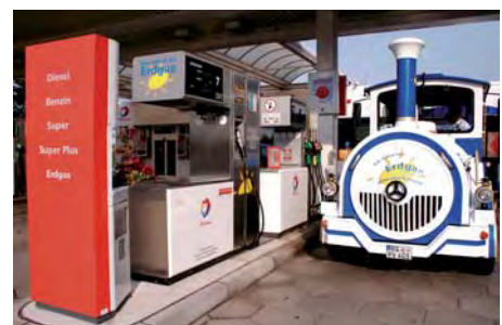
Seit 2004 rollt die zweite Generation des „Stahlmaxe“. Er hat mit 180 PS hundert mehr als sein Vorgänger. Betrieben wird er mit umweltfreundlichem und sparsamem Erdgas. Seinen Durst löscht er an der Erdgastankstelle an der Lauchhammerstraße.