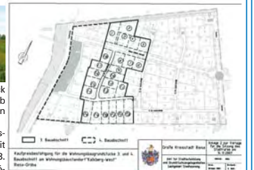
Kaufpreisschätzung für die Wohnbaugrundstücke 3 und 4. Bebaubarkeit am Wohnungsbaustandort „Kalkberg-West“.

nach 8 Baugrundstücke im neu fertig gestellten 3. Bauabschnitt zur Verfügung. Die Grundstücksgrößen betragen zwischen 490 und 922 m 2 .