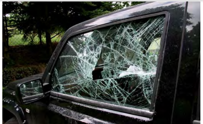
Bei einem solchen Anblick ist der Schreck natürlich groß, und der Ärger folgt meist auf dem Fuß. Aber oft ist es grobe Fahrlässigkeit der Autobesitzer, die mit sichtbar gelagerten Taschen, Jacken, Laptops, Handys und Navigationsgeräten Einbrüche geradezu provozieren.

Als im Sommer vergangenen Jahres drei junge Leute nachts mit einem Tresor im Auto spazieren fuhren, wurden die Polizeibeamten, die das Fahrzeug kontrollierten, natürlich stutzig. Die Ermittlungen ergaben, dass das Trio mit wechselnder Tatbeteiligung für 15 Einbrüche mit einem Schaden von rund 40.000 Euro verantwortlich war. Damit hatte die Riesaer Polizei eine Einbruchserie aufgeklärt, die vor allem im Zeitraum von April bis Juni 2008 Firmen und Geschäfte in der Stadt und der näheren Umgebung betroffen und für erhebliche Unruhe gesorgt hatte. Dieses Beispiel unterstreicht eine Feststellung von Hermann Braunger, dem Leiter des Riesaer Polizeireviere, bei seinem Vortrag zur Kriminalitätsentwicklung vor dem Oktober-Stadtrat: Von 2.622 im Vorjahr in der Stadt Riesa erfassten Straftaten wurden 1.806 aufgeklärt. Ermittelt wurden dabei 1.234 Tatverdächtige, von denen viele also für mehrfache Vergehen „zuständig“ sind. Mit einer Aufklärungsquote bei allen Straftaten von 68,9 Prozent liegt das Polizeirevier Riesa in Sachsen weit über dem Durchschnitt. Von den Körperverletzungen konnten beispielsweise 95,5 Prozent geklärt werden. Typisch ist hier, dass sich die Beteiligten meist alle kennen, weil sie aus dem entsprechenden Milieu stammen. Und häufig ist Alkohol im Spiel. Die Wahrscheinlichkeit, Opfer einer Körperverletzung zu werden, ist für